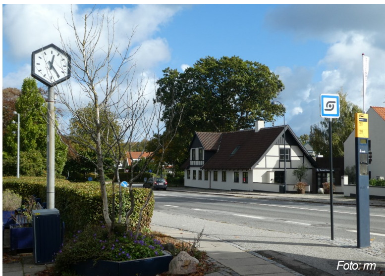
Det udgåede Duetræ ( Davidia involucrata )

Træet gik ud og står nu på 4. år med sine triste grene. /rm&sg